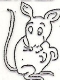
en glad lille mus