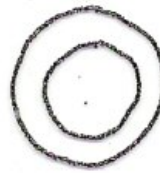
og bogstavet "o"