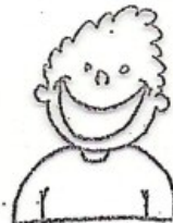
et barn der er glad