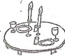
et veldækket bord